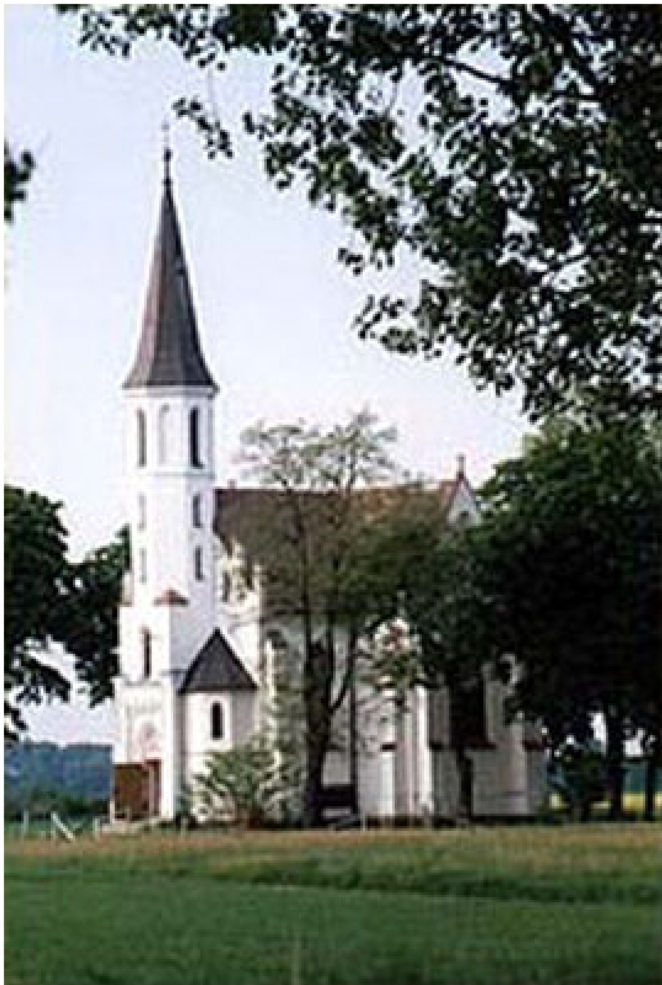
Powstańców Śląskich 17, 48-320 Skoroszyce