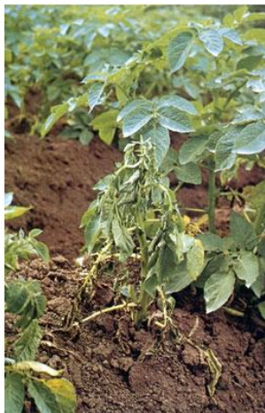
Fot 1 i 2. Wędnące rośliny ziemniaka